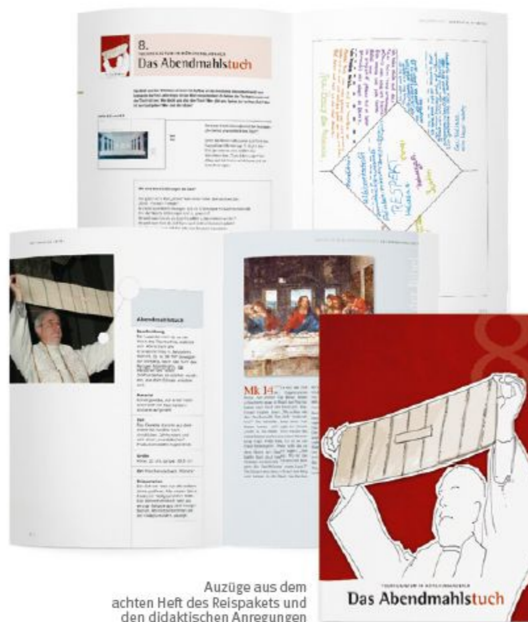
Auszüge aus dem achten Heft des Reisepaketes und den didaktischen Anregungen

► Fax an: 0241/946 97 99 Hüsch & Hüsch GmbH · Mühlradstr. 3-5 · 52066 Aachen Tel. 0241/946 97-0 · www.huesch.de · bestellung@huesch.de