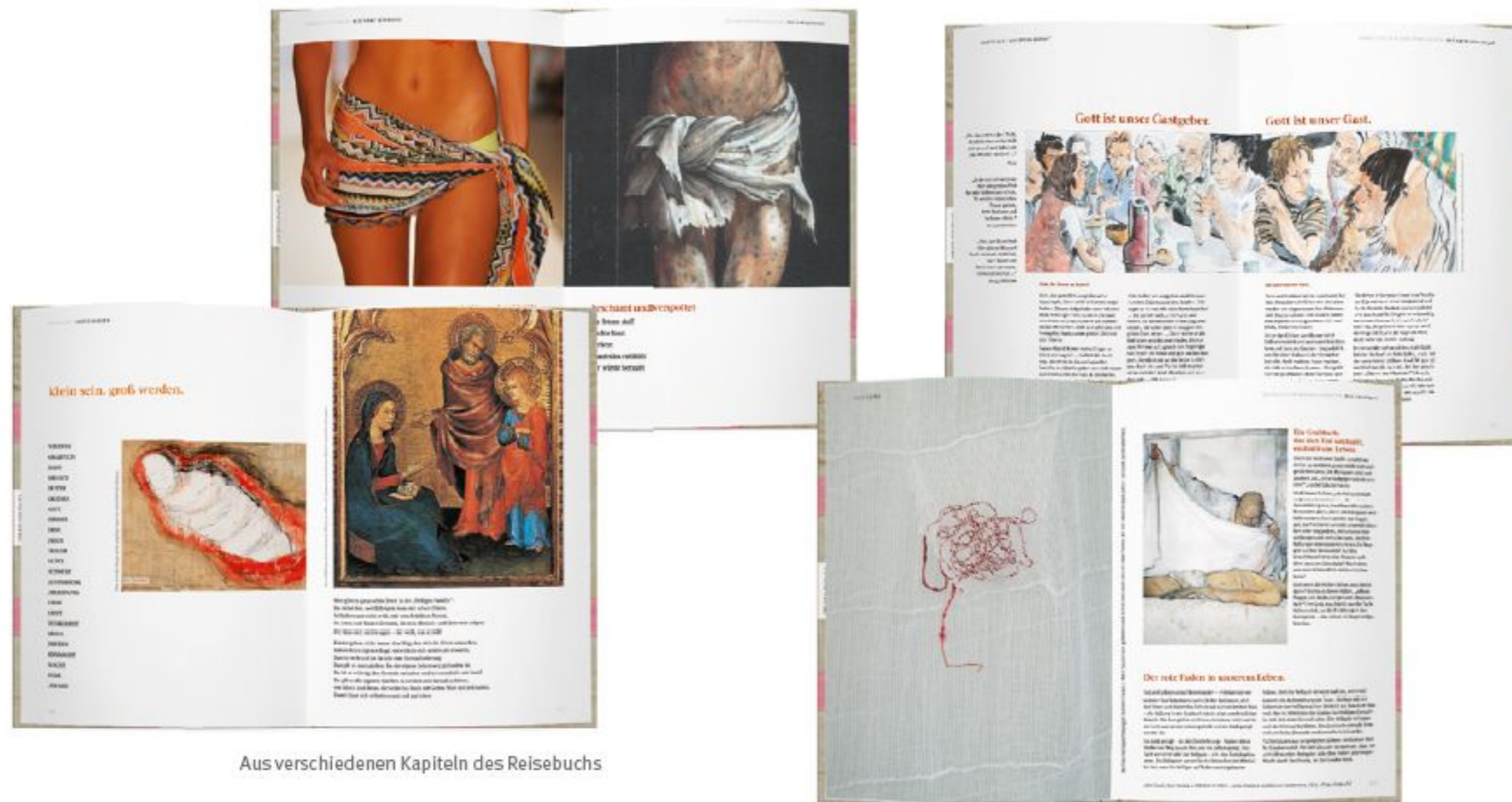
Aus verschiedenen Kapiteln des Reisebuchs

In diesem „Reisebuch“ werden die Stoffheiligtümer aus Aachen, Kornelimünster und Mönchengladbach in den Blick genommen. Alle verweisen auf eine andere Wirklichkeit, die mit unserem Leben zu tun hat.